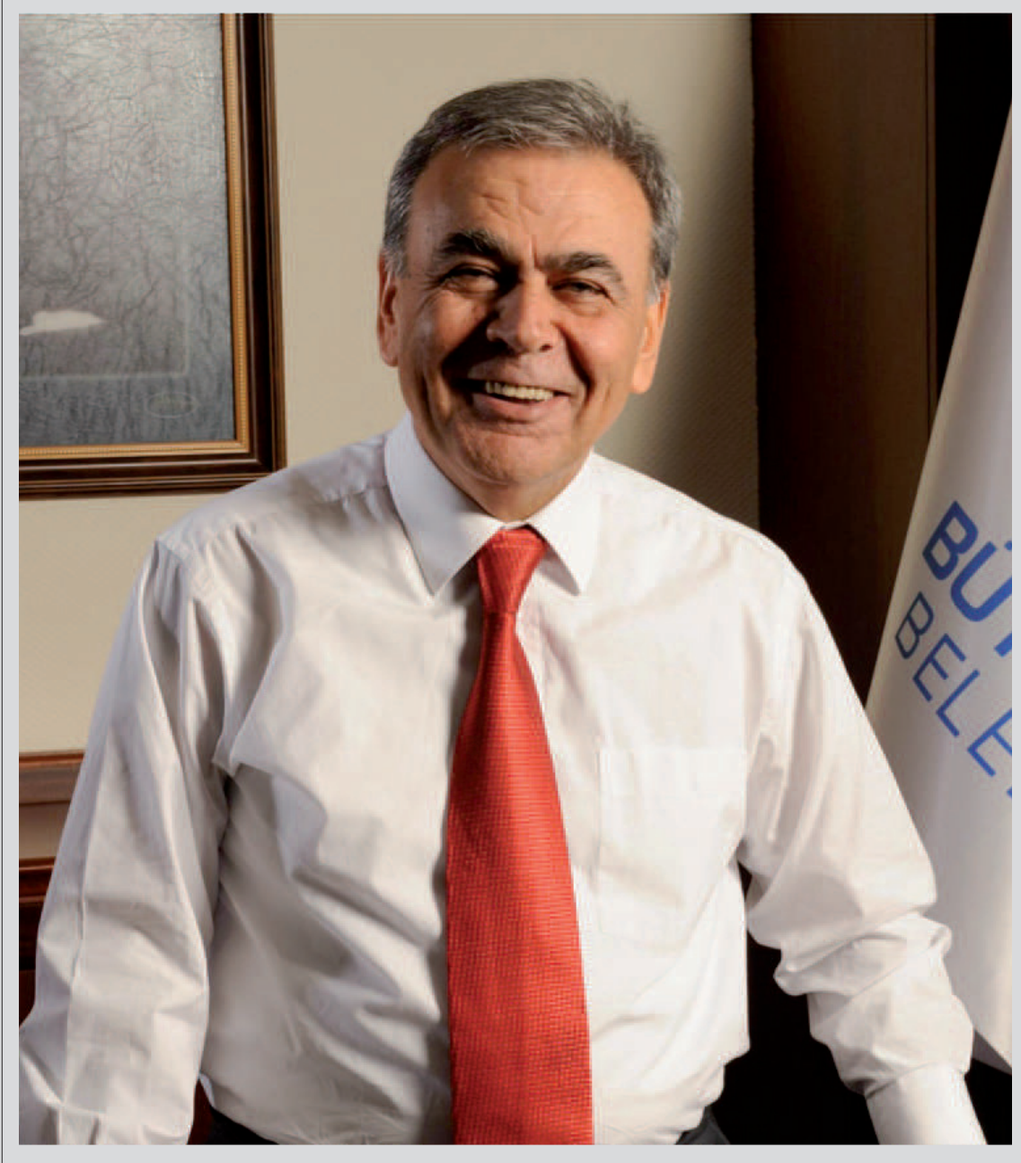
Aziz KOCAOĞLU İzmir Büyükşehir Belediye Başkanı