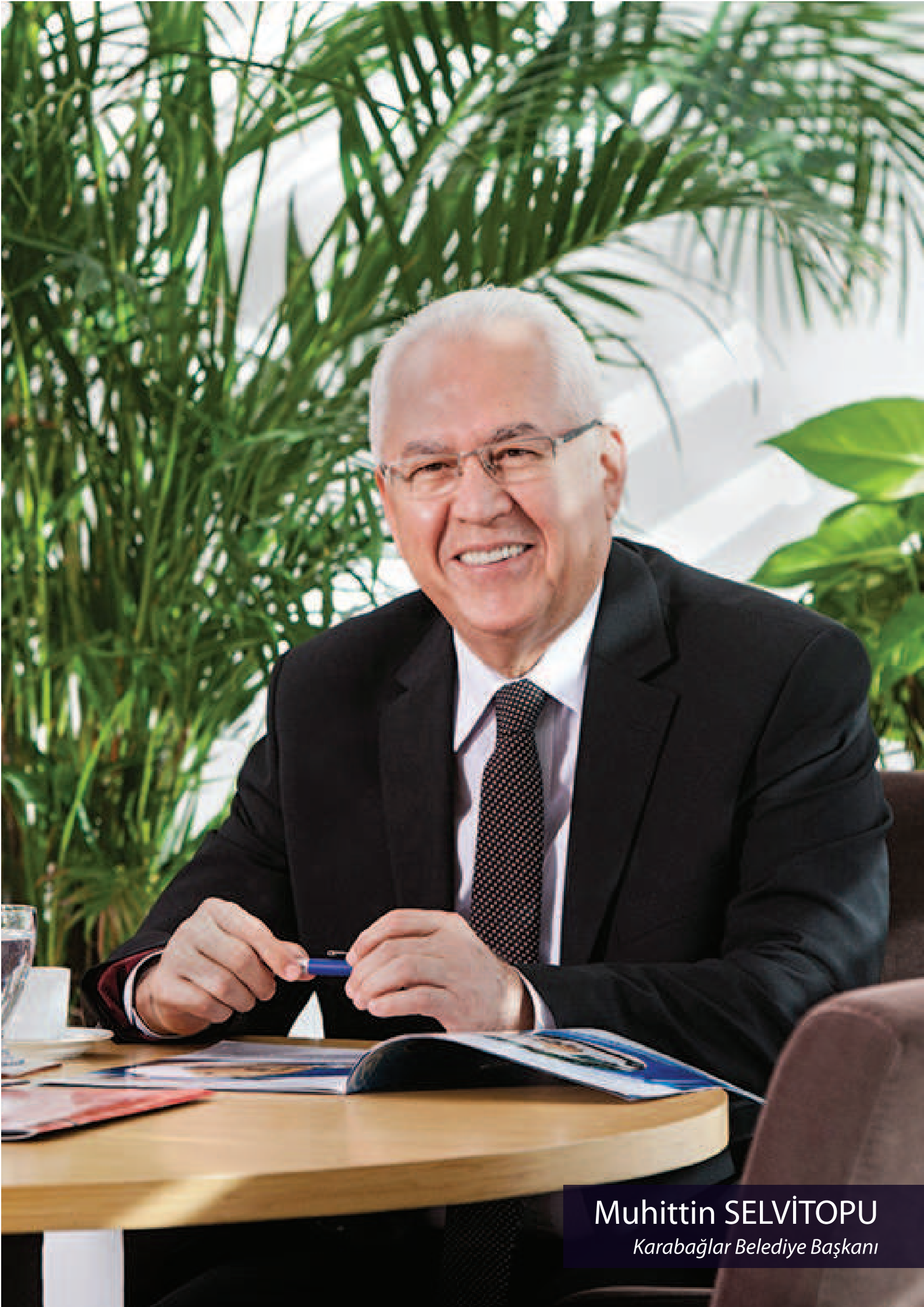
Muhittin SELVİTOPU Karabağlar Belediye Başkanı