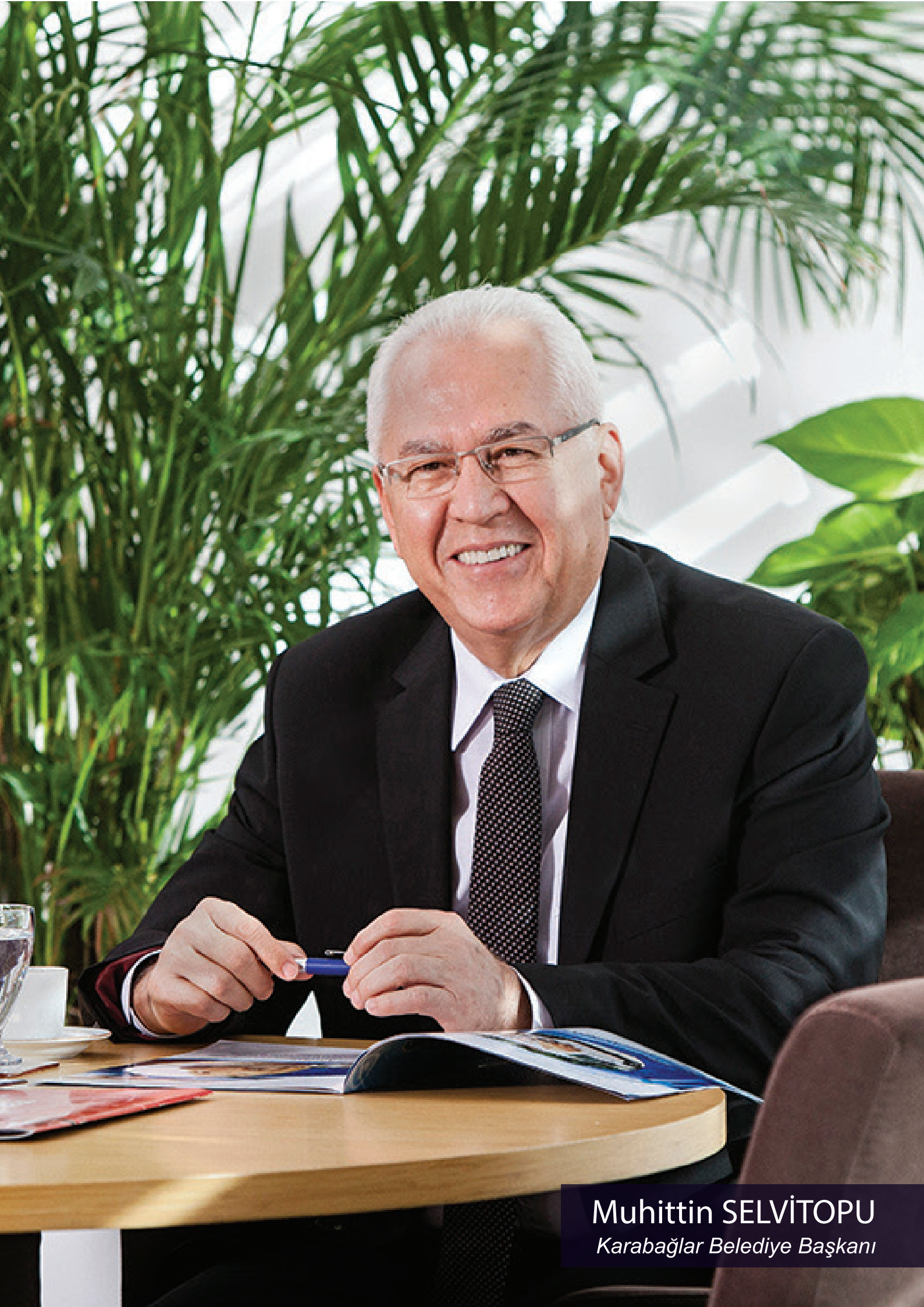
Muhittin SELVİTOPU Karabağlar Belediye Başkanı