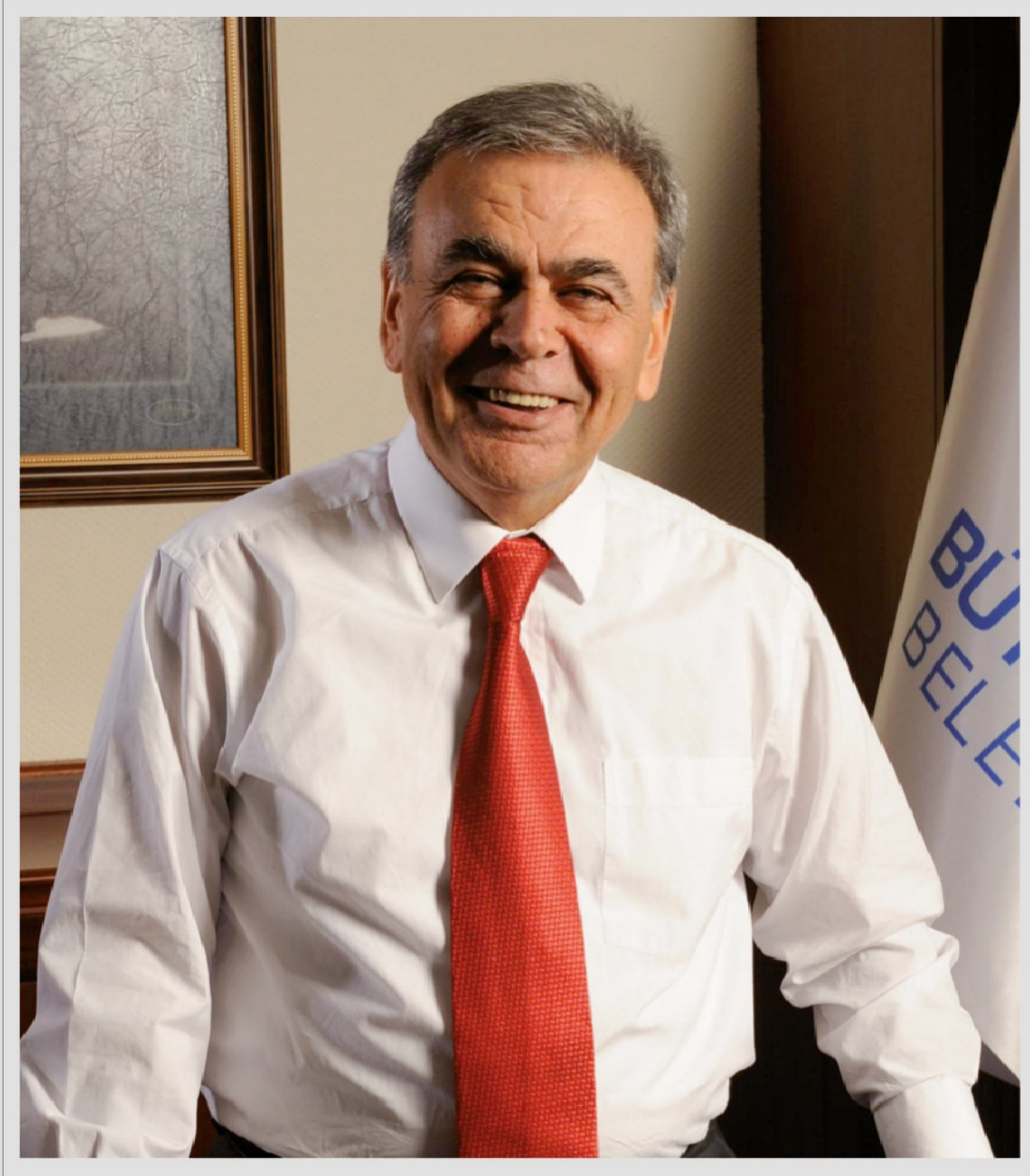
Aziz KOCAOĞLU İzmir Büyükşehir Belediye Başkanı