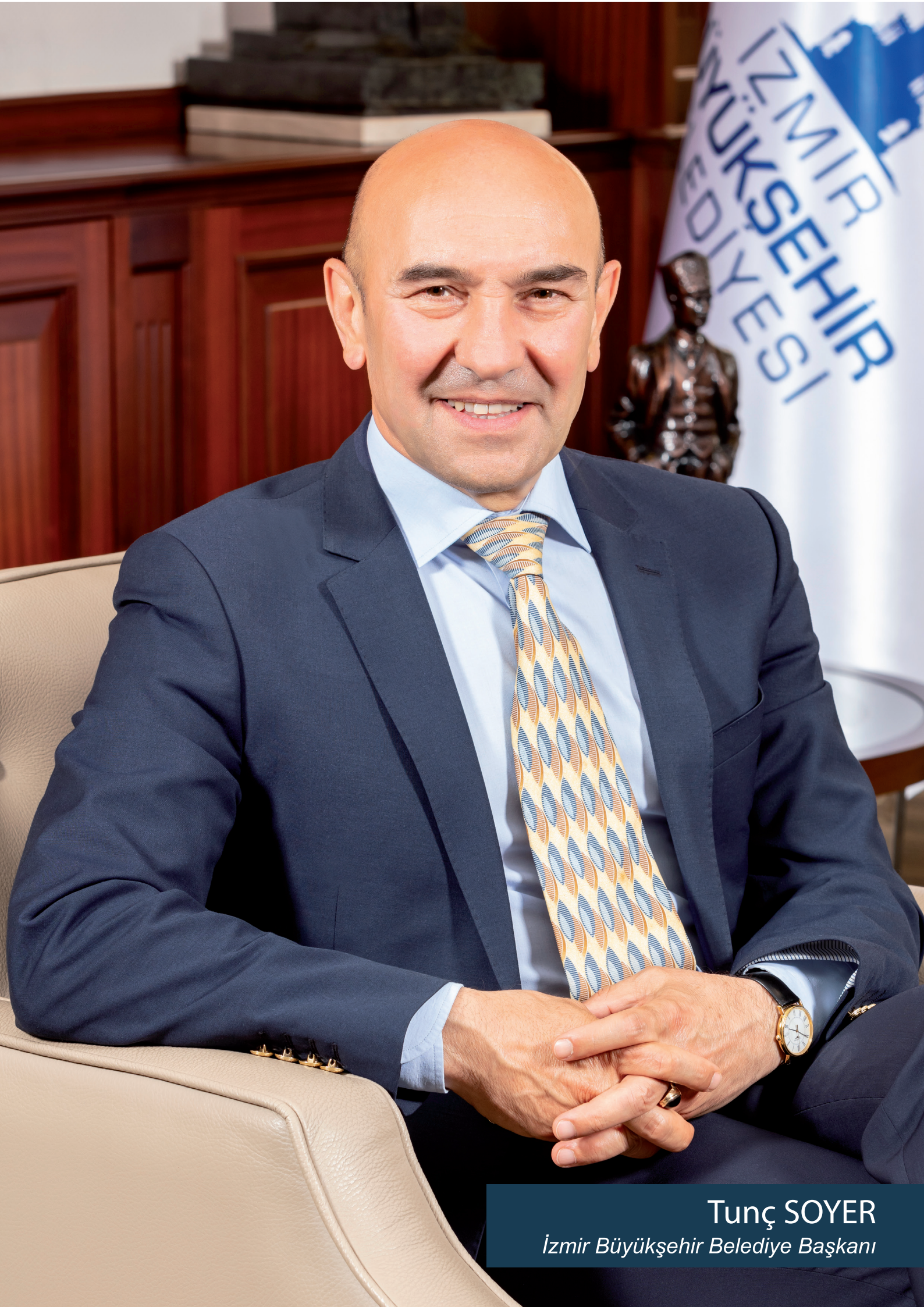
Tunç SOYER İzmir Büyükşehir Belediye Başkanı