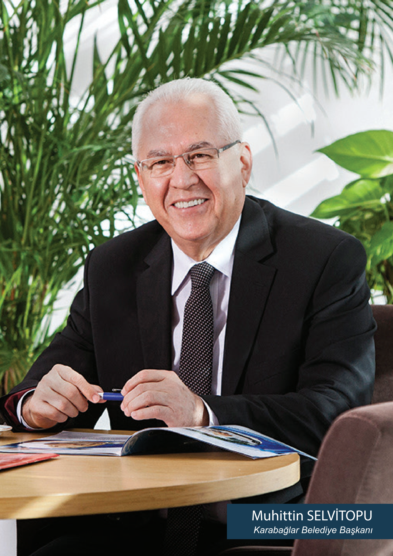
Muhittin SELVİTOPU Karabağlar Belediye Başkanı