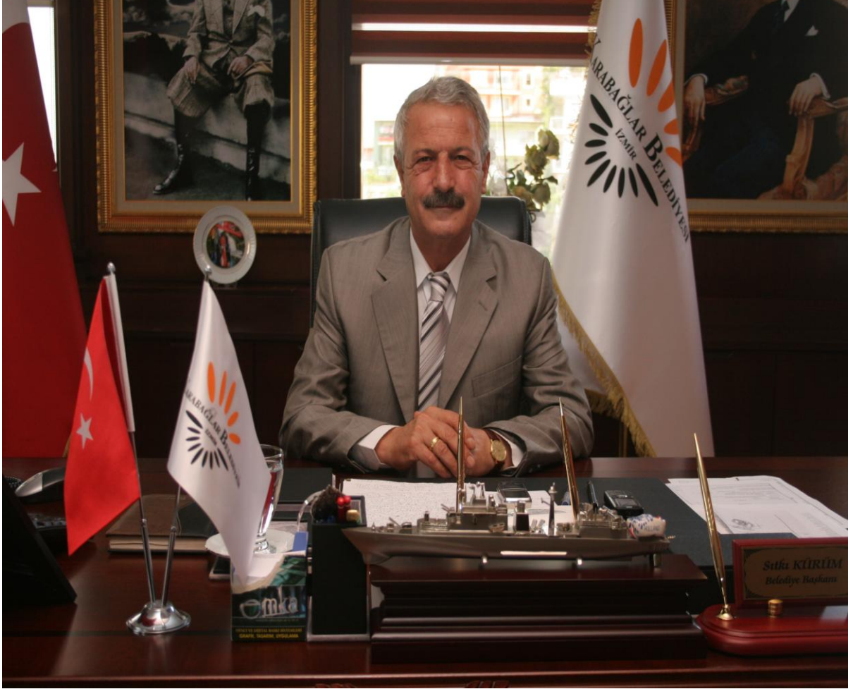
K. SITKI KRM KARABAĖLAR BELEDİYE BAřKANI